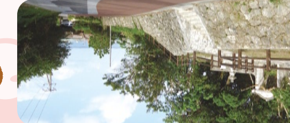
歷史和文化融合的街道

交通(駕車) 《一般道路(一般公路)》那霸機場→國道58號線→國道330號線→村道仲順·屋宜原線(大約45分鐘) 《中壘自動車道(高速公路)》那霸IC→北中壘IC→縣道81號線→國道330號線→村道仲順·屋宜原線(大約15分鐘) *目的地為Ayakari之社(生涯學習複合設施)開車能到北中壘