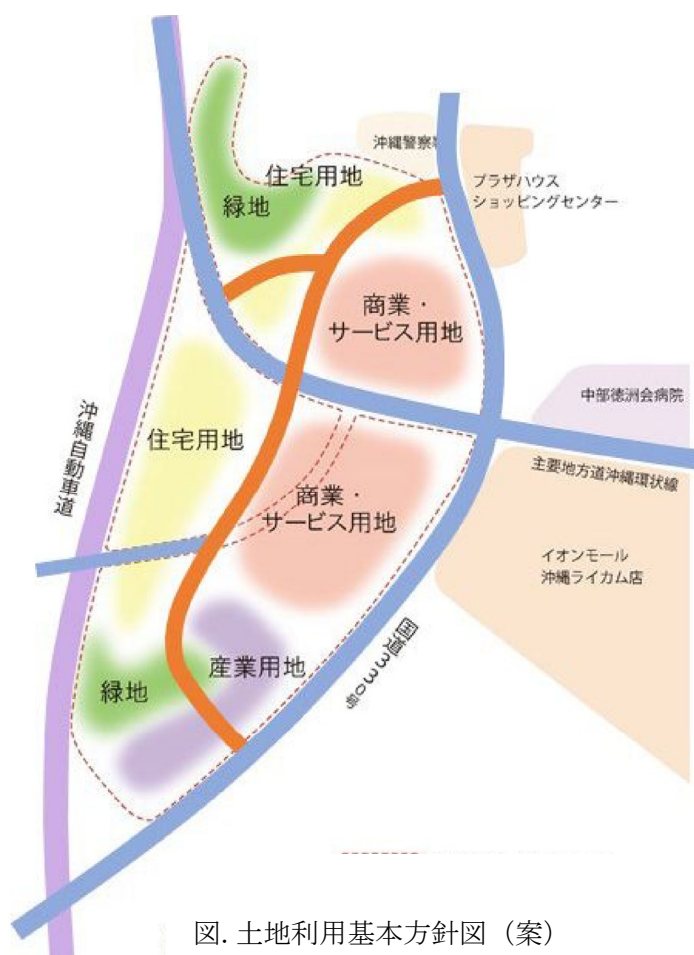
図. 土地利用基本方針図 (案)

今後も、地権者・行政・関係者が連携しながら、まちづくりの具体化に向けた協議・調整を継続する予定であり、返還後、速やかに、土地区画整理事業の組合設立認可を目指します。