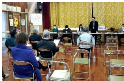
●住民説明会の様子（荻道地区）