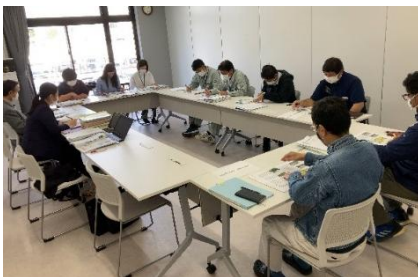
●ワーキンググループ会議 第3回