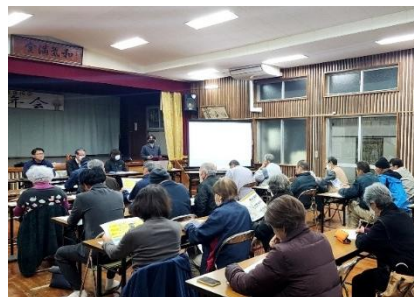
●荻道・大城地区 合同説明会