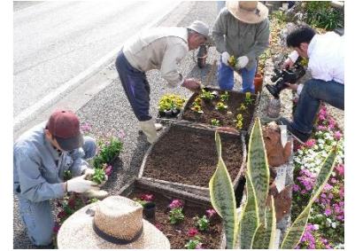
花咲爺会による緑化活動

北中城村南部のグスクを望む集落では、ウマチーなどの祭祀や花咲爺会による緑化活動など、地域住民を主体とした多様な活動が行われている。