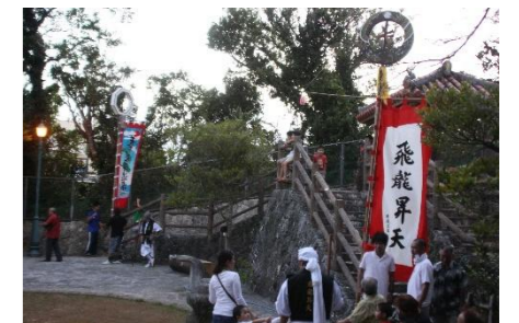
荻道・大城のハタスガシー

御嶽や神屋、カーなどの聖地を舞台に、ハタスガシーや綱引きといった祭祀が執り行われている。聖地を拝する人々の厳かな佇まいと祭祀の賑わいが重なり合い、地域への信仰に根差した歴史的風致を形作っている。