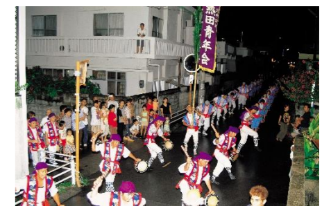
熱田のエイサーの道ジュネー

各集落の聖地などを舞台として行われる民俗芸能であるエイサーは、演舞の躍動感や太鼓の響き、そしてそれを見守る地域の人々の賑わいが重なり合い、集落を一体とした歴史的風致を形成する。