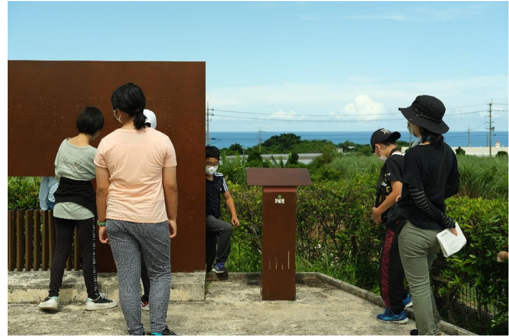
↑「さとうきび畑」の歌の歌詞が刻まれた歌碑。ボタンを押すと、オルゴールが流れます。