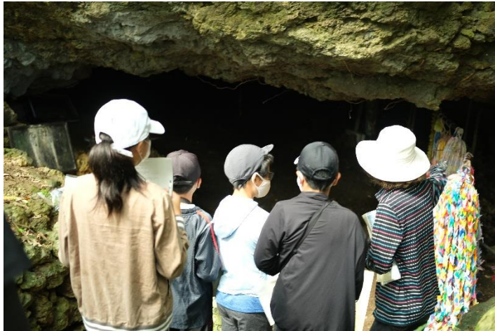
↑ 読谷村チビチリガマでガイドを受ける様子。