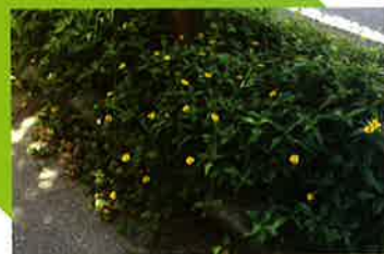
街路樹の脇に意図的に刈り残されているアメリカハマグルマ ▶

黄色のきれいな花をつけるため、除草作業後も観賞用の「お花」と認識されやすく、意図的に刈り残されています。そのため、雑草等が刈り取られた整った環境で、さらに繁殖を続けることになってしまいます。