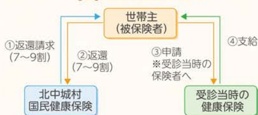
【図】医療費返還の流れ