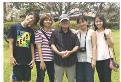
家族は皆仲良し。いつも支えてくれる大切な存在。