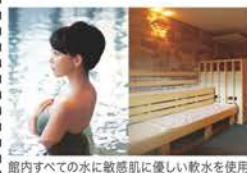
館内すべての水に敏感肌に優しい軟水を使用