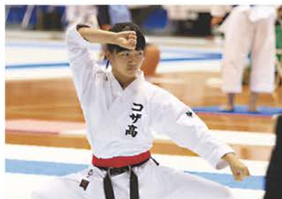
高校時代の空手の試合会場での1枚。黒帯、二段の資格保持者！

1994年生まれ。島袋小、北中城中、コザ高校卒業。フィリピン人の父、沖繩出身の母を持つ。2019年春に琉球大学を卒業。英語教員免許取得。2017年の泡盛の女王。好きな食べ物はイチゴ。