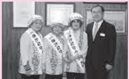
美寿きたなかくすくの皆さん

美寿きたなかくすくは80歳以上の元気な女性を対象に、毎年福祉まつりで選出されています。