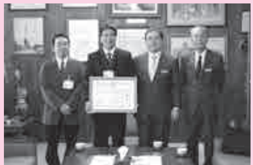
表彰おめでとうございます

子ども達に命を大切にすることを大切にする気持ちや他人への思いやりの心を育んでもらうことを目的として、11月13日北中城小学校1年生を対象に人権教室が行われました。人権擁護委員の方々が講師になり「世界をしあわせに」を題材にDVD上映やいじめ・差別等について、1年生に応じた内容でわかりやすく生徒さんに語りかけました。