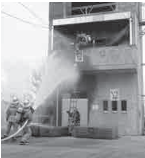
緊迫感漂う訓練風景