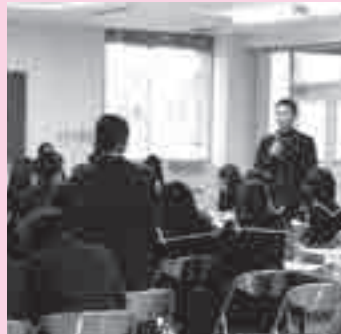
フォーラムの様子

北中城中学校では、うちなーぐちであいさつをすることや体育祭で学級旗コンテストを行ったことを紹介し、学校全体で良い雰囲気作りを心がけていることをアピールしました。