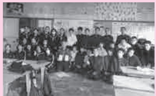
早く元気になってね