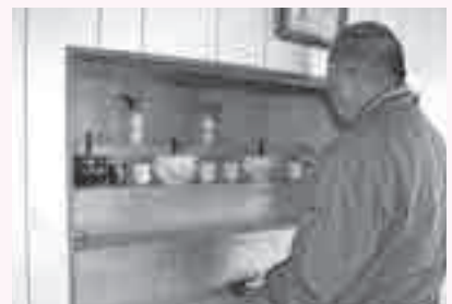
蒲小嶺の祭壇に線香を供える