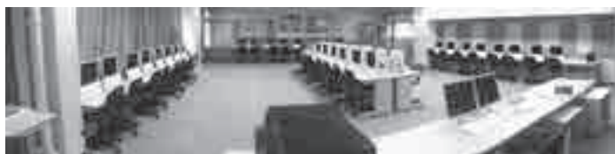
パソコンが整備された教室

平成27年度特定防衛施設周辺整備調整交付金を活用し、島袋小学校のパソコン教室に新たなパソコン機器が整備されました。授業を円滑に行う環境が整えられたことにより、情報教育の更なる充実が期待されます。