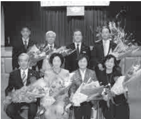
功労者表彰の皆さん