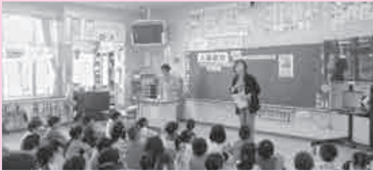
思いやりの心を養いました