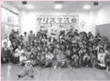
楽しいクリスマス会の様子

☆毎月お便りを発行していますのでご覧ください。（北中城村役場HPに掲載しています。）