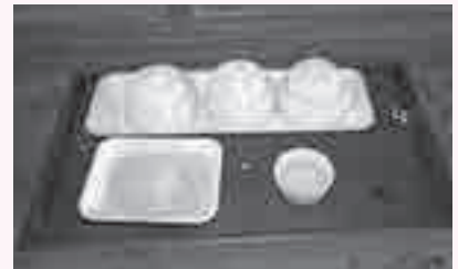
フトウチウガンの供物

島袋のフトウチウガンは自治会長が執り行います。供物として、花米、酒、ウチャヌク(神仏に供える餅)、線香を用意して、最初にノロ殿内 ノロノ を拝みます。ノロ殿内とは、琉球王府時代に各村落の祭祀を司ったノロと呼ばれる神女の住居で、そこにはノロ火又神が祀られています。戦前、島袋には島袋ノロがいて、島袋・比嘉・渡口の村落祭祀を司っていました。現在、ノロという神女はいなくなりましたが、村落祭祀を行う上で、ノロ殿内が拝みの起点となっています。