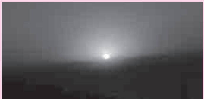
きれいなわかてだでした