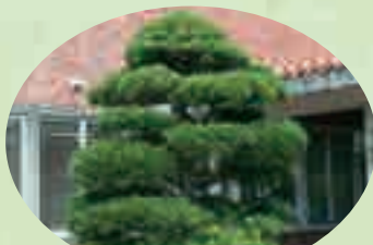
村の木…リュウキュウコクタン

お知らせ……………8～13 マナビイ……………14 掲示板……………15 話題あれこれ……………16