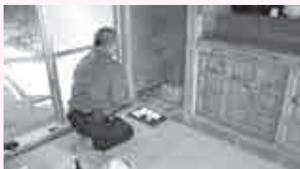
島袋ノロ殿内の火又神を拝む

次に、蒲小嶺 カマクンミ (屋号)の神屋を拝みます。蒲小嶺とは、島袋の草分けの旧家とされています。このように、島袋ではフトウチウガンで字の一年を締めくくり、旧正月を迎えます。