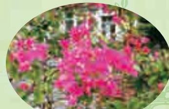
村の花木…フーゲンビレア