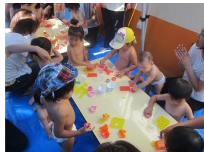
『冷た〜い! 寒天遊び』 プルプル感触が楽しいよ♪