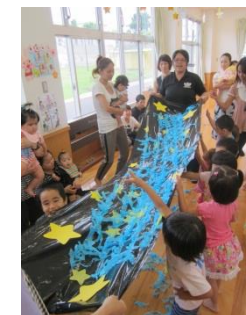
『七夕会』 紙をビリビリ破って皆で天の川を作りました♪