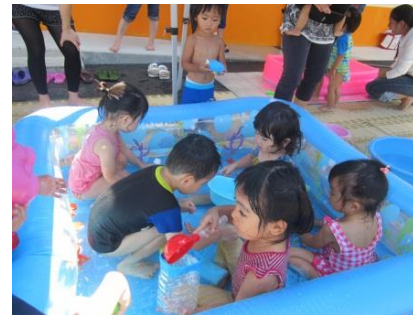
『水遊び』 お水は冷たくて気持ちがいいね♪